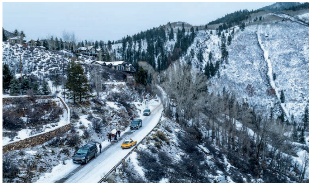
Making Of Aspen - 1973